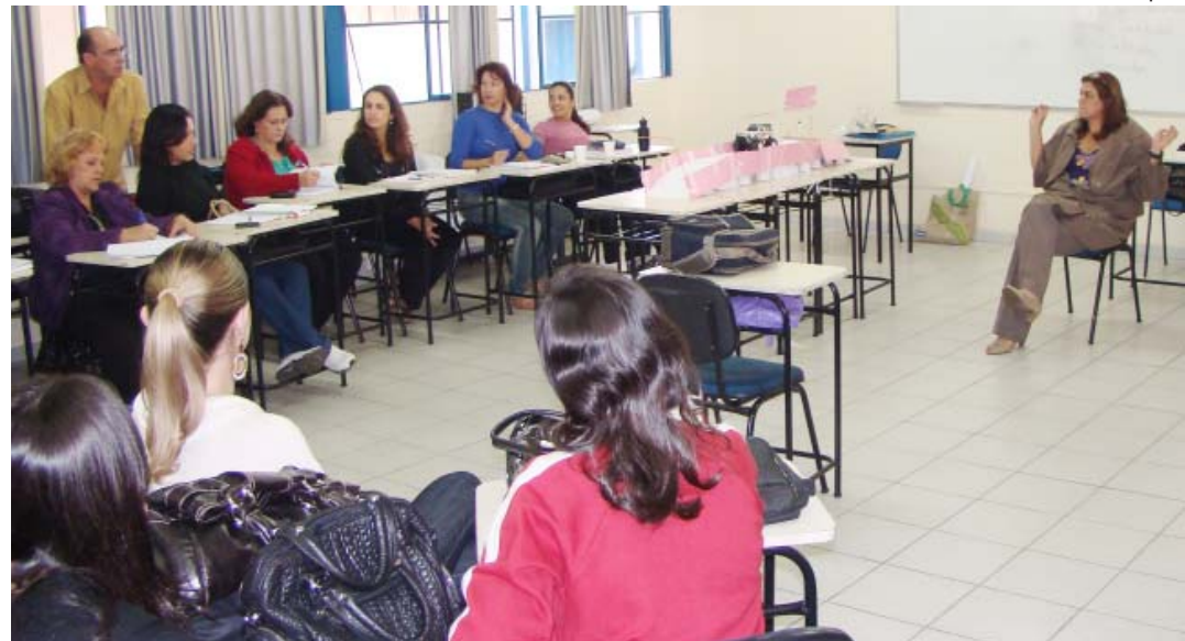
Gestão Organizacional: sexta turma de especialistas das ciências gerenciais

Para os cursos de pós-graduação, a Funcec mantém parceria com a Prefeitura de João Monlevade que concede bolsas parciais para seus servidores efetivos, conforme aprovado em lei municipal.